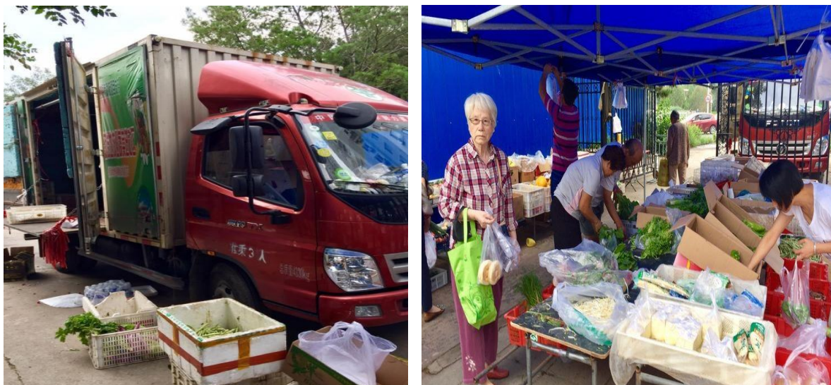
图 2 蔬菜运输车、赶集的临时蔬菜大棚

后来经过打听才知道，綦江区有志强、发源地、百悦、小杜等几家较有名气的蔬菜配送中心，基本都建立有完整的蔬菜配送运营流程体系。对有些蔬菜为了提高周转速度、保证鲜度，虽由配送中心向供应商订货，但是供应商不是将蔬菜发给配送中心，而是直接发给各个门店或者临时经营点。这种配送方式适用于大批货物销售，不仅流程最短，也最节约物流成本。村民进城卖菜的日子恰逢赶集，菜商自然也会跑来，规模化、集约化、专业化的蔬菜配送方式当然比几个村民约好的配送方式更加便捷、便宜、高效。至此，龙泉村的蔬菜通过村民自发运送到集市上售卖的想法已基本“破灭”。