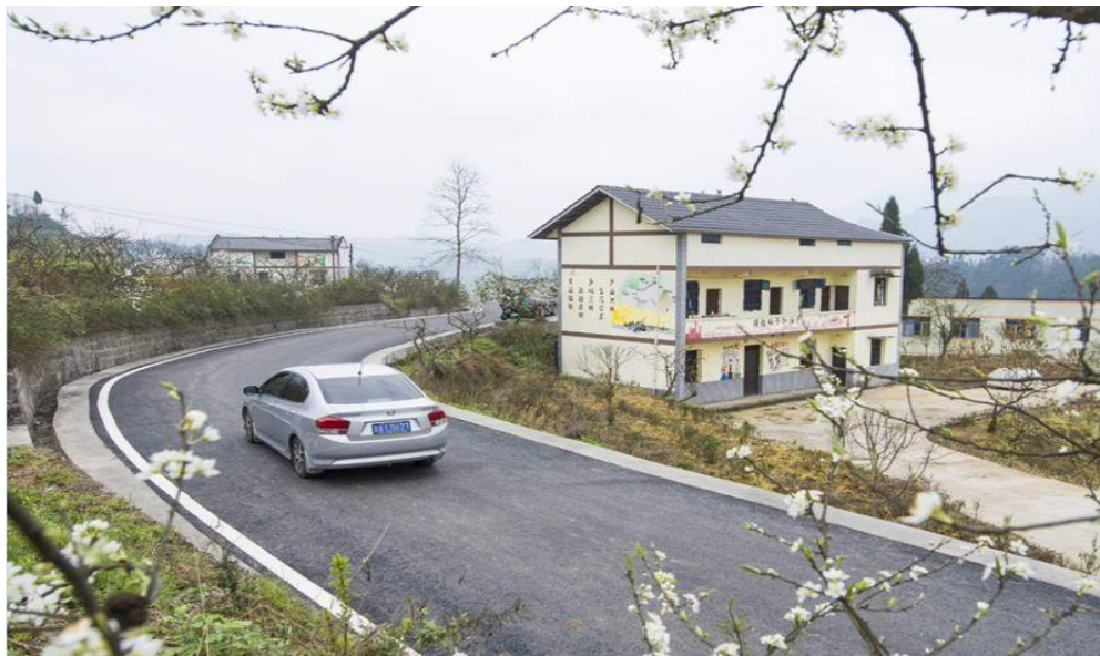
图 1 郭扶镇龙泉村村级公路

很多线路都处在亏损边缘。没通车的线路我们也不想跑，能方便村民。但目前油价这么高，跑那些线路肯定是会亏的。”另一位农村客运车主算了一笔账，农村客运车辆每年缴纳的养路费、运管费、保险费与城市客运车辆一样多，而农村线路票价则相对低廉。同时，农村道路路面状况与城市公路不可相提而论，由此所造成的车辆油耗和损耗都远远高于城市客运车辆，大大挤压了农村客运的利润空间。摆在面前的只有两个选择，涨价或者依靠政府补贴支持，否则客运公司也只能对那些偏远的乡村线路“敬而远之”。