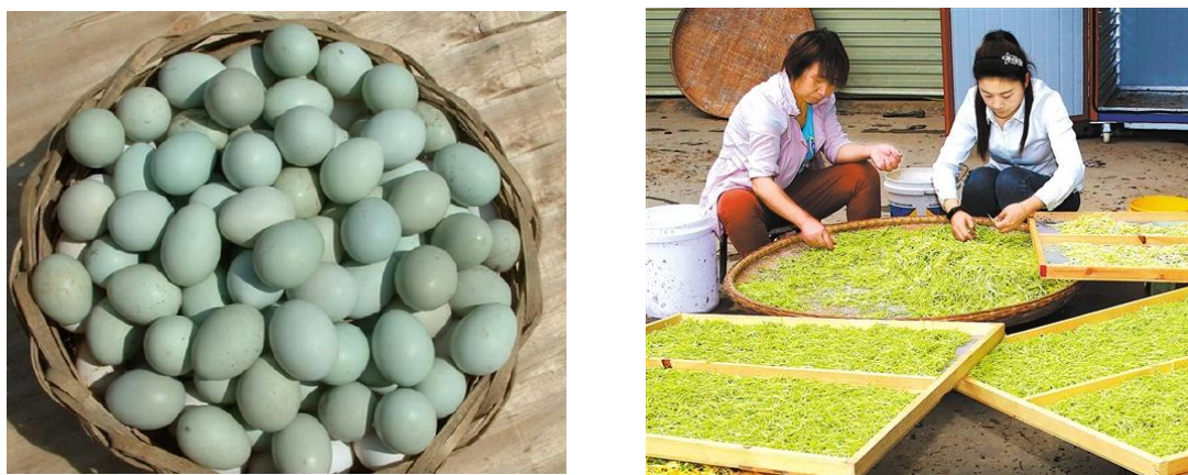
图 4 龙泉村的特色农产品

农村物流的落后境况不仅造成村民出行不便，还变相地增加农货的出村成本，显然已成为制约乡村建设、提升农村群众生活福祉的明显短板。随着脱贫攻坚、乡村振兴、农业农村现代化等国家战略的贯彻实施，解决农村物流的“最后一公里”难题正初现“曙光”。