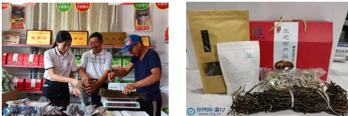
图 14 即将外运的农产品

利用自己牵头成立的村集体公司——隆泉人家生态旅游开发有限公司,承接村电商服务站的运营,并利用打造的属于村集体的公共品牌“龙泉仁家”,依托“互联网+”,作为交邮融合线上支撑渠道。另一方面积极向镇、区两级争取政策支持,在修桥铺路等基础设施上下功夫。2021年,龙泉村最终在郭扶镇镇政府的牵线搭桥下入选綦江区交邮融合试点村。