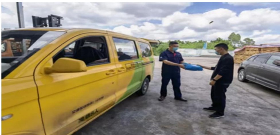
图 9 龙泉村乡村“货的”

“往年村里的土特产，像冬笋、土鸡啊，要自己送到镇上快递寄出去，现在方便啦，公交司机直接到村里收，马上就能送出去，客户拿到货的时候也新鲜，销量也增加了。”张女士是龙泉村一家民宿的老板娘，她表示，这条服务专线的开通，解了龙泉村村民的燃眉之急。交邮融合的发展不仅方便了龙泉村民，也带动了当地经济发展，更助推了行政管理的高效化、精细化和人性化，在老百姓中赢得了广泛的认可，纷纷为交邮融合的推广和发展点赞。