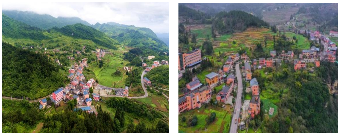
图 15 龙泉村鸟瞰图