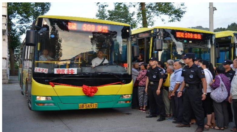
图 7 郭扶镇公交投入运营

任何一项政府工作的开展，归根结底都是为了人民群众的幸福。龙泉村试点工作的开展，无论过程如何曲折，其出发点和落脚点也只能是为了让村民能够生活得更便捷、更幸福。