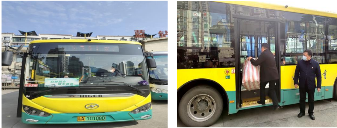
图 10 “交邮融合”专线公交

随着客货同网模式的快速发展，区域电商平台“红蚂蚁商城”“菜坝网”“大美綦江商城”与八谷公司、共午商贸公司等纷纷入驻龙泉村，在极大方便居民的同时，也解决了农产品进城和大件货物运输问题，促进了物流与电商协同发展，助力了城乡物资的双向流动，为农村经济发展增添了新的可能，注入了新的活力。