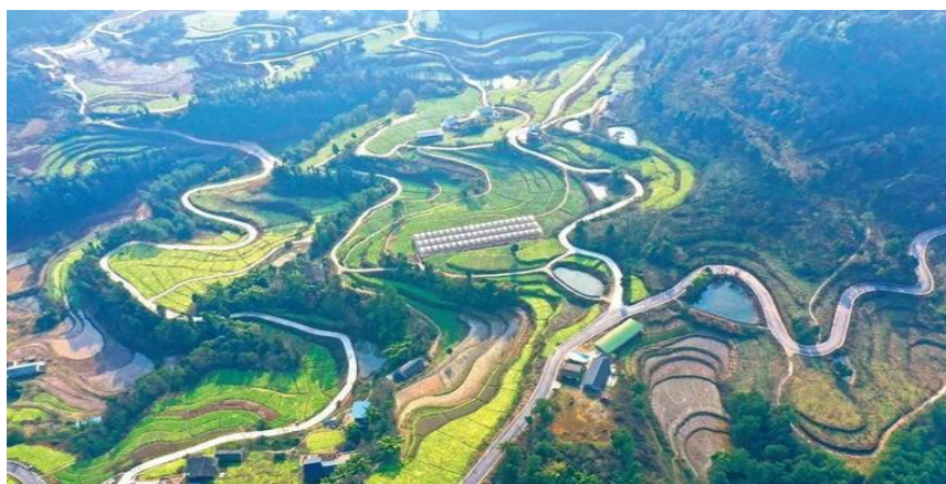
图 5 綦江区“四好农村路”

怎样才能避免这种让政策成为“空中楼阁”的现象在綦江区再次重演？应当采取怎样的措施才能让交邮融合这一政策真正落到实处、收到实效、得到实惠，是保证这一政策执行效果的关键所在。