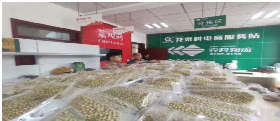
图 11 龙泉村电商服务站

随着客货同网模式的快速发展，区域电商平台“红蚂蚁商城”“菜坝网”“大美綦江商城”与八谷公司、共午商贸公司等纷纷入驻龙泉村，在极大方便居民的同时，也解决了农产品进城和大件货物运输问题，促进了物流与电商协同发展，助力了城乡物资的双向流动，为农村经济发展增添了新的可能，注入了新的活力。