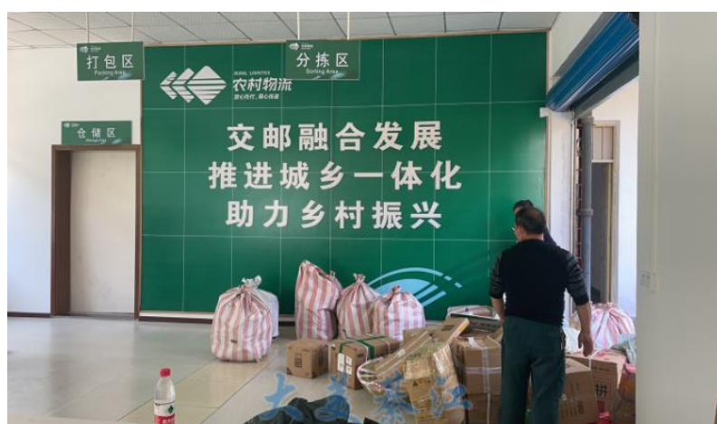
图 8 邮政公司郭扶综合服务站

龙泉村通过街镇公交或班线客车等运力资源开展邮件带运，平均每月输送快递到龙泉村 6000 余件，农产品进城 300 余件，“货畅其行”让群众在家门口增收致富。截至 2022 年 12 月，綦江建制村直接通邮率达 100%，快递服务进村覆盖率达 100%。交邮融合政策实行以来，綦江区加强与邮政管理、商务、供销和农业农村等多部门对接，主动整合资源、争取政策，让企业之间共配共享，实现集约化发展。并加快构建畅通便捷、经济高效、便民利民的区、镇、村三级农村客运邮政物流体系，充分利用街镇公交、农村客运班线网络和客运站资源，在确保客车行车安全前提下，积极开展客车带货业务，有效解决乡村快递运营成本高、快递不进村等问题。