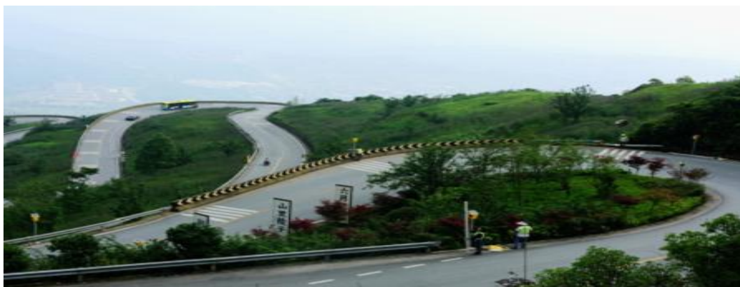
图 12 綦江营运车辆托管监控中心

电商销售出去。外地顾客也可以通过网上下单购买这里的农特产品，服务站工作人员负责邮寄。交邮融合的实施，快递及网络平台的入驻，补上了快递业基础设施存在的短板，提升了偏远农村地区快递服务能力，有利于降低工业品下乡、农产品进城的运输成本，缩短了农村物流中转时间，提高了效率，提升了农村电商消费的服务品质和消费体验、促进农村产业振兴，帮助村民致富。